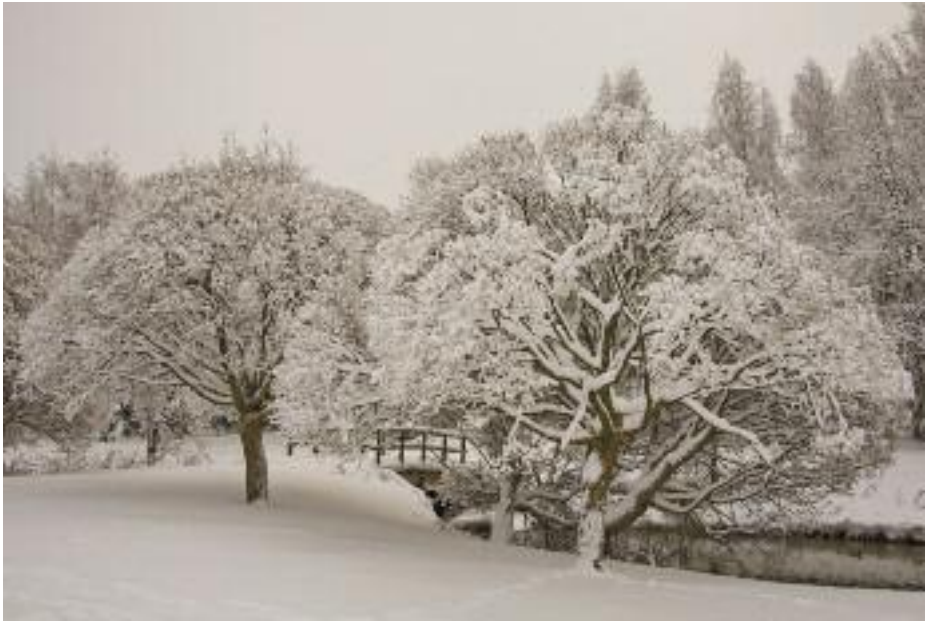
JAAKKO ILVES Harmaa talvipäivä