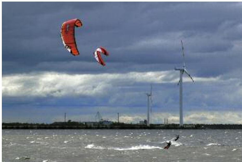
VESA JAKKULA Tuulivoimaa