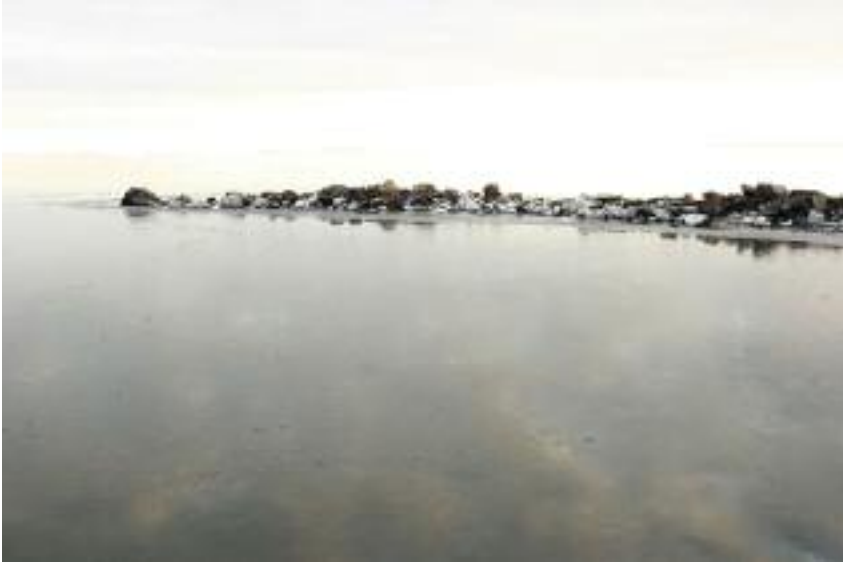
TAMMIKUUN KUUKAUDEN KUVA OLLI KESKINEN