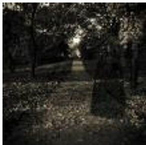
RAIMO DAHL Ghost lane