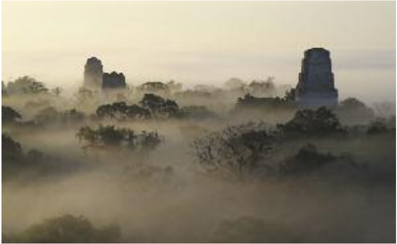
AN-SOFIA NEELY Usva