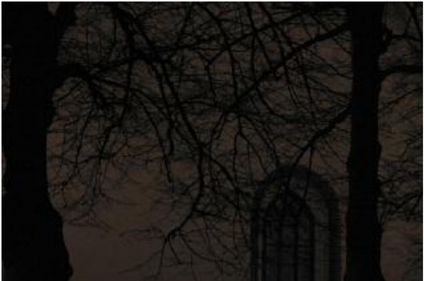
LAURI VIHONEN Uusi vuosi Porvoossa