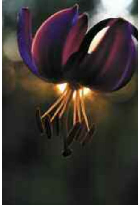
OLLI KESKINEN Lilja

Opintokerhon tulokasluokan kilpailut pidetään aina pöytäkilpailuna ja kuvaformaatti on vapaa. Siis kuvat tuodaan vasta kokoukseen ja saavat olla paperivedoksia, tiedostoja tai dioja. (max. 4 teosta / kuvaaja, teoksista yksi saa olla 4 kuvan sarja) Kilpailun lisäksi kukin saa tuoda 1 – 4 mielestään hyvää tai huonoa kuvaa keskustelun pohjaksi. Ideana on että kuvaaja saa kommentteja kuvistaan, parannusehdotuksia kuvaamiseen, tai olisiko se omasta mielestä epäonnistunut otos sittenkin hyvä?