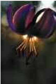
KANSIKUVA: OLLI KESKINEN Lilja